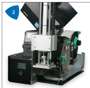
2 Compact, fiable et facile d'accès pour l'opérateur.