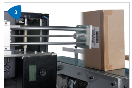
3 Système flexible (pose des étiquettes sur la face supérieure, inférieure ou latérale quel que soit l'angle requis).